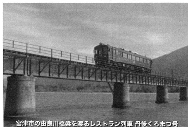
宮津市の由良川橋梁を渡るレストラン列車 丹後くろまつ号