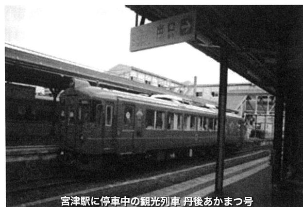
宮津駅に停車中の観光列車 丹後あかまつ号