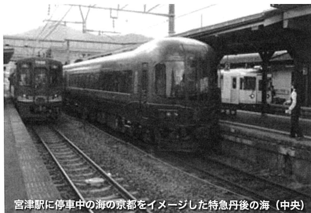
宮津駅に停車中の海の京都をイメージした特急丹後の海（中央）