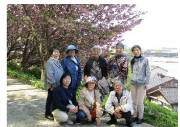
筒石：海の見える丘公園

令和8年度最初の事業は筒石地区と仙納地区の花めぐりでした。八重桜や椿などを見ながら地区内を散策し、徳合地区のしだれ桜も見てきました。これで磯部6地区を全て巡ったこととなりますが、来年はどこの桜を見に行こうかな(^O^)