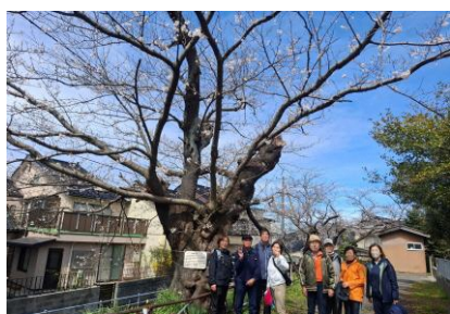
伐採が決まったささら公園にて

今年も、毎月第2日曜日をウオーキングの日として計画しています。その都度、コース等回覧にてお知らせさせていただきます。