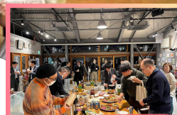
過去卒業生との交流