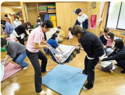
健康運動指導士による運動教室