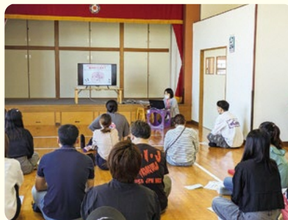
保健師による生活リズム健康教室

子ども一貫教育方針のもと、こどもたちの健康な身体づくりに向け、保護者の方を対象に、「生活リズム」「食育」「愛着形成」「運動」「じゃれつき遊び」のテーマで、希望があった保育園・幼稚園で健康教室を実施しました。生活リズム健康教室では、規則正しい生活リズムで過ごすことで心や身体にどのような効果があるか、電子メディアとの正しい付き合い方などを学びました。運動教室・じゃれつき遊び教室では、保護者と園児が、身体を使った様々なプログラムを体験し、終了後にはどの園児からも笑顔が見られました。