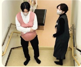
妊婦体験ジャケット