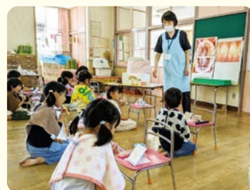
ブラッシング指導