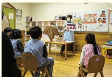
歯の健康について