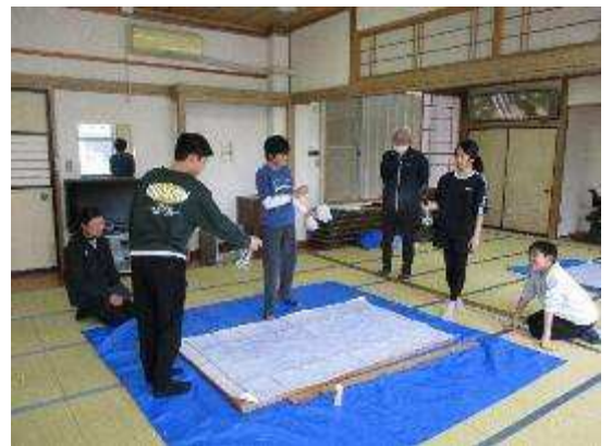
最後に霧を吹いて仕上げます

毎回、作業はもちろんありがたくて、なによりも幼い頃から事あるごとに関わらせてもらってきて、背も大きくなり、言葉遣いや行動に成長を感じる奉仕活動です。