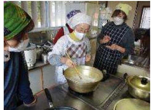
里芋の煮え加減をチェック

今の米粉はサラサラのため水は多めに・・・などアドバイスをもらいながら作りました。里芋のつるつるとしたなめらかさと、表面をあぶった香ばしさがとてもおいしかったです。