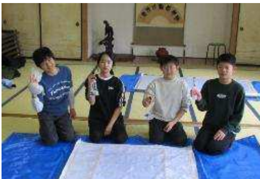
5人の6年生この日は1人欠席でしたががんばりました