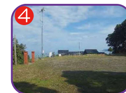
4 百川多目的広場 海拔 21.1m