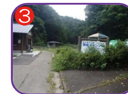
3 荒崎キャンプ場 海拔 21.4m