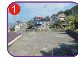
1 仁平様駐車場 海拔 22.1m