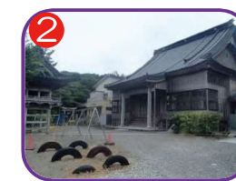
2 安専寺 海拔 22.0m