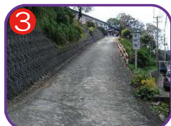
金剛院本堂前 海拔 18.8m