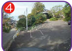
実相院駐車場 海拔 29.3m