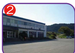
能生駅前広場 海拔 11.2m