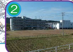
能生中学校(指定避難所) 4階建・海拔 15.0m