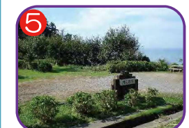
大王あじさい園上部駐車場 海拔 37.8m