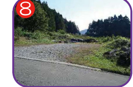
笠原建設資材置場 海拔 35.6m