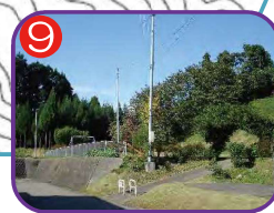
丸山公園 海拔 27.9m