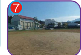
海洋高等学校 海拔 42.0m