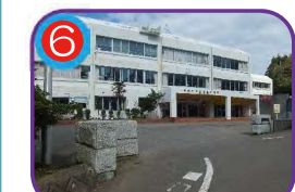
能生小学校(指定避難所) 海拔 21.0m