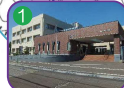
能生生涯学習センター 3階建・海拔 7.0m