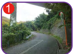
上崩農道入口 海拔 31.5m