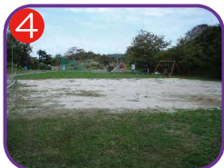
鬼舞農村公園 海拔 22.7m