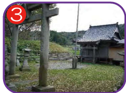
正八幡宮 海拔 30.0m