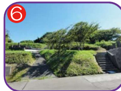
向山 海拔 21.0m