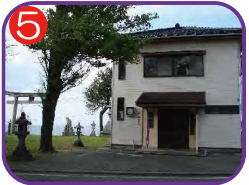
鬼舞地区多目的集落センター 海拔 16.2m