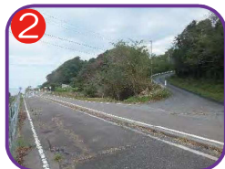
丸つぶれ農道 海拔 41.8m