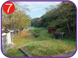
木浦公園 海拔 11.6m