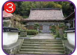
禅雄寺 海拔 24.2m