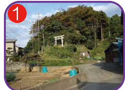
中宿 三柱神社 海拔 20.6m