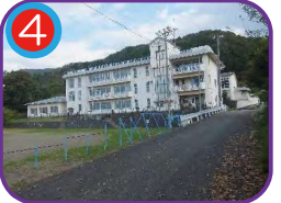
旧浦本小学校 (指定避難所) 海拔 45.0m