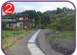
市道十二社線駐車場 海拔 21.7m