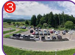
信越ポリマー西棟駐車場 海拔25.4m