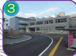
糸魚川東中学校 (指定避難所) 3階建・海拔20.0m