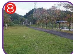
大和川忠魂碑 海拔21.2m