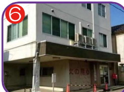
大和川自治会館 海拔7.7m