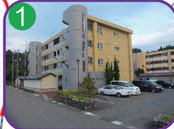
市営田伏住宅1号棟 4階建・海拔7.6m