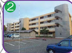
市営田伏住宅2号棟・3号棟 4階建・海拔7.7m