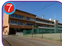
大和川小学校 (指定避難所) 海拔8.6m