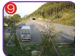
東バイパス駐車場 海拔26.1m