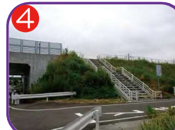
東バイパス高台 海拔12.0m