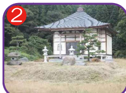
善正寺太子堂前広場 海拔15.9m