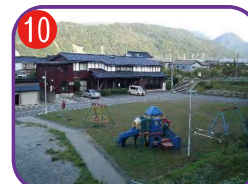
梶屋敷区民会館 海拔11.0m