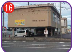
糸魚川建設会館 海拔 9.2m