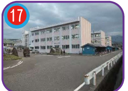
糸魚川高等学校 (指定避難所) 海拔 12.0m