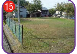
京ヶ峰公園 海拔 18.0m