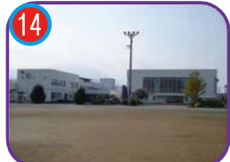
糸魚川東小学校 (指定避難所) 海拔 8.2m