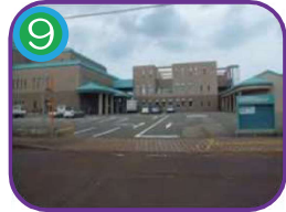
ビーチホールまがたま 3階建・海拔 7.8m