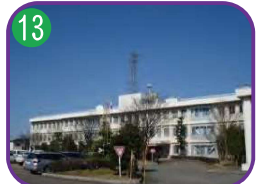
糸魚川地域振興局 3階建・海拔 10.0m