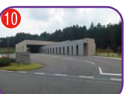
糸魚川市斎場 海拔 30.0m