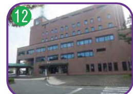
糸魚川市役所 7階建・海拔 10.0m