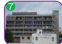
糸魚川翠明苑 8階建・海拔 3.6m