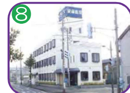
安藤医院 4階建・海拔 5.0m