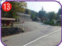
七社駐車場 海拔 22.6m