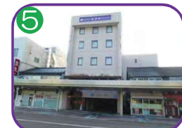
ホテルそぴや 5階建・海拔 4.0m