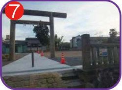
山乃井神社 海拔 12.0m