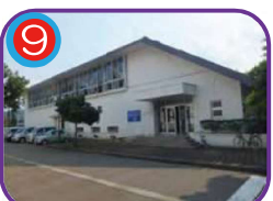
亀ヶ丘体育館 (指定避難所) 海拔 10.2m