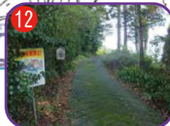
蓮台寺 茶煙坂 海拔 15.1m