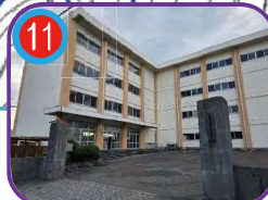
糸魚川白嶺高等学校 4階建・海拔 14.0m