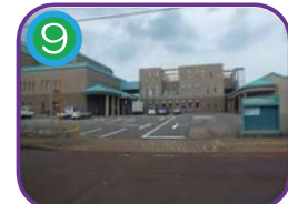
ビーチホールまがたま 3階建・海拔 7.8m