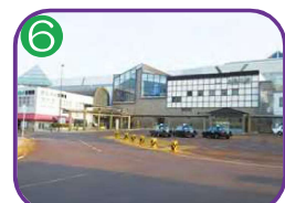
糸魚川駅 3階建・海拔 5.2m