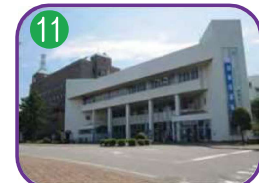
糸魚川市民会館 3階建・海拔 10.0m