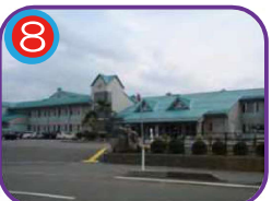
糸魚川中学校 (指定避難所) 海拔 34.0m