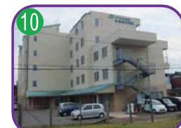
糸魚川みなみ翠明苑 5階建・海拔 3.8m