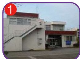
1 寺島区民会館 海抜6.0m