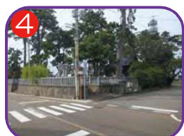
4 秋葉神社 海抜10.2m