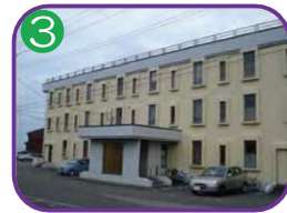
3 市営西浜住宅13号棟 3階建・海抜11.2m