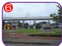
6 なかのきり公園 海抜7.2m