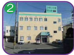
2 たつみ旅館(別館) 3階建・海抜5.3m