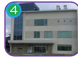
4 糸魚川地区公民館 (指定避難所) 3階建・海抜10.0m