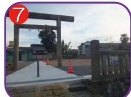
7 山乃井神社 海抜12.0m