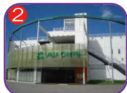
2 デイサービスセンターえが (ヴィラオレッタ2階) 海抜11.4m