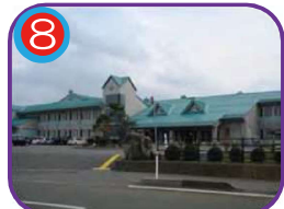
8 糸魚川中学校 (指定避難所) 海抜34.0m