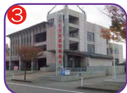
3 糸魚川市消防本部 海抜15.3m