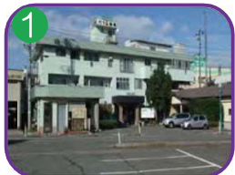
1 たつみ旅館 3階建・海抜5.3m