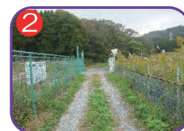
2 今村新田 五宿 海拔 5.9m