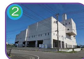
2 清掃センター 6階建・海拔 5.1m