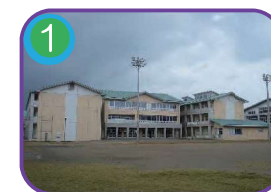
1 田沢小学校 (指定避難所) 3階建・海拔 10.6m