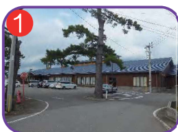
1 青海総合福祉会館 (ふれあい) 海拔 5.1m