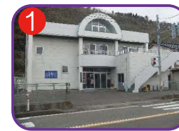
玉の木支館 海拔 7.1m