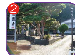
長圓寺 海拔 13.9m