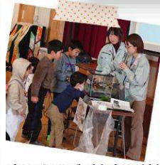
木のクイズ（糸魚川地域振興局 農林振興部 林業振興課・糸魚 川市農林水産課）