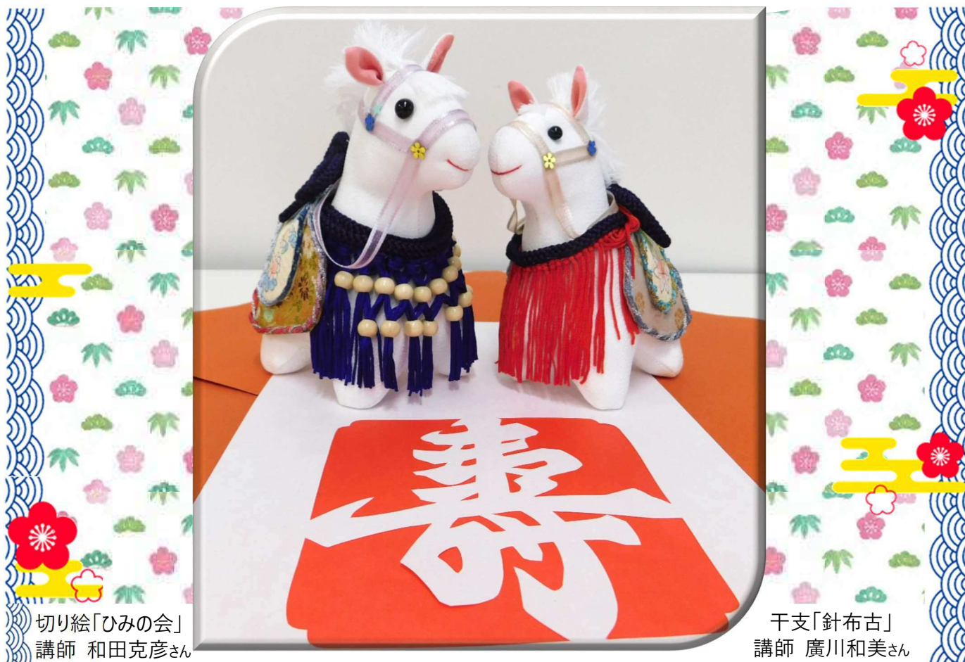
切り絵「ひみの会」 講師 和田克彦さん

■発行日 / 1月25日発行 ■住所 / 〒941-0067 糸魚川市横町1-14-1 ■Eメール / itoko@bz04.plala.or.jp