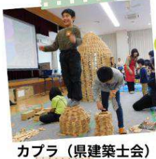
カブラ（県建築士会）