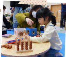
木のおもちゃ（おもちゃや木のこ）