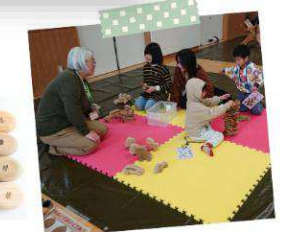
糸魚川産木材での作品展示（ラ ンバー羽生・今井スポーツ）

本年度で第2回目の開催。市内7団体より出展がありました。子ども達は木製玩具に囲まれ楽しそうに遊び、クイズへの挑戦や、慎重にカブラや積み木を扱う真剣な様子も見られました。大人もスプーン製作などに積極的に取り組み、親子の笑顔溢れる姿が多く見られました。