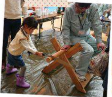
丸太切り（緑でつなく未来創造会議/ 3M・糸魚川商工会議所）