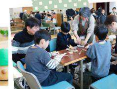
カトラリーづくり（つむぎ日和）