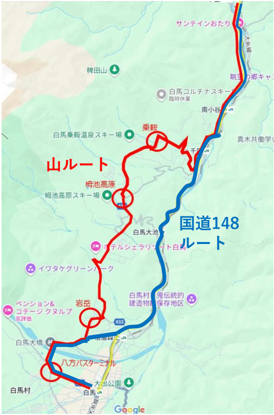
運行ルートイメージ（赤色：現行 青色：改定）