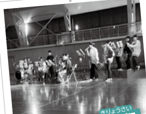
糸魚川高校 亀陵祭 きりょうさい