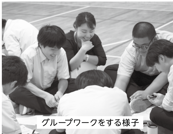
グループワークをする様子

自分の苦手になっていることを克服するために、記憶力や思考力などが必要だと感じたため、これから身に付けていきたいし、苦手なことを好きなことに変えていきたい。