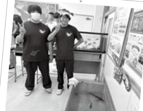
海洋高校 井凌祭 せいりょうさい