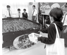
糸魚川白嶺高校 白嶺祭 せりょうさい