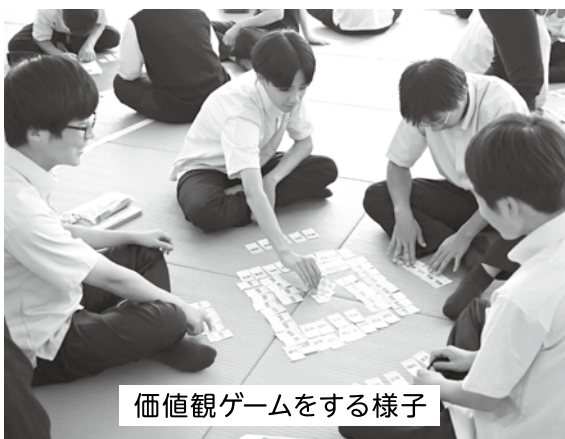
価値観ゲームをする様子

年に4回、日々の様々な取組を整理し、将来の進路選択につなげる「キャリア」の学習を行っています。前半の2回は自分と向き合う時間に焦点を当てた授業となりました。