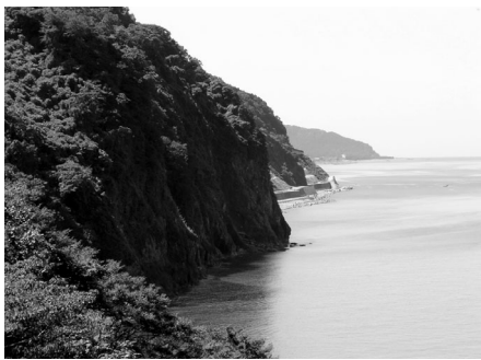
親不知ジオサイト

市民への周知については、市の広報やマスコミを通じ周知するとともに、各種イベントにおけるパネル展、各地域・企業・団体への出前講座、学校での学習支援等により着実に進めている。 今後、更に多くの地域に