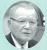
野本 信行 議員