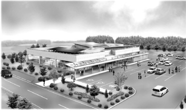
健康づくりセンター完成予想図