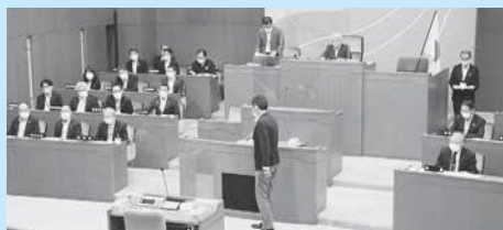
議場での投票の様子

※○は賛成、×は反対 ※議長（松尾徹郎議員）は表決に加わりません。 ※修正動議とは……原案に対し、議員が修正の提議を行うとき提出する動議のこと。