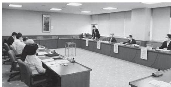
新潟県福祉保健部地域医療政策課、糸魚川保健所と懇談