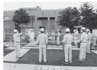
糸魚川浄化センターを視察