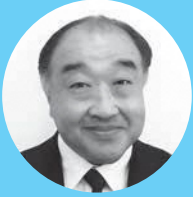
和泉 克彦 議員