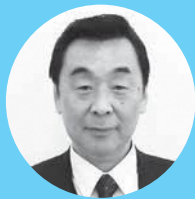
古畑 浩一 議員