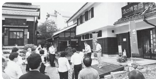
旧酒の博物館を視察

「大きな水がめとしての北アルプス、そして水のまち大町」 「SDGs未来都市『みずのわプロジェクト』について」