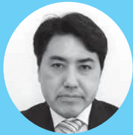
保坂 悟 議員