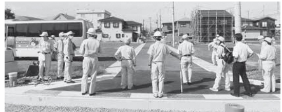
市道認定について現地視察

答弁 道を寄贈する者のメリットは、市道認定後の維持管理や除雪に係る費用の負担がなくなることである。市のメリットは道路設置に係る工事費や用地費等の支出がないことである。