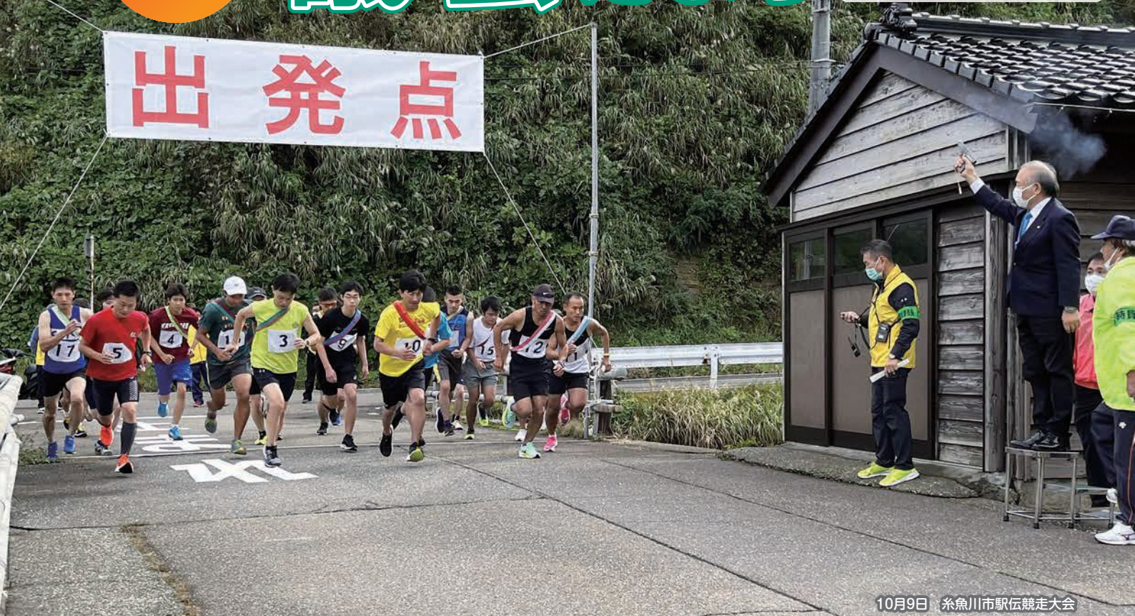
10月9日 糸魚川市駅伝競走大会