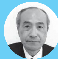
渡辺 栄一 議員