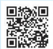
本会議 生中継配信

※本会議及び予算審査特別委員会の録画映像はYouTube「糸魚川市議会 チャンネル」で配信しています。