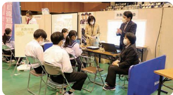
糸魚川市議会ブースでの様子

10月7日に市内の中学3年生を対象とした「キャリアフェスティバルいといがわ2022」が開催され、市議会のブースを出展しました。ブースを訪れた中学生に市議会議員の仕事ややりがいなどを話しました。