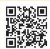
糸魚川市議会 ホームページ