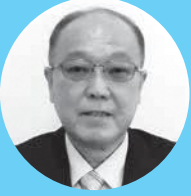
中村 実 議員