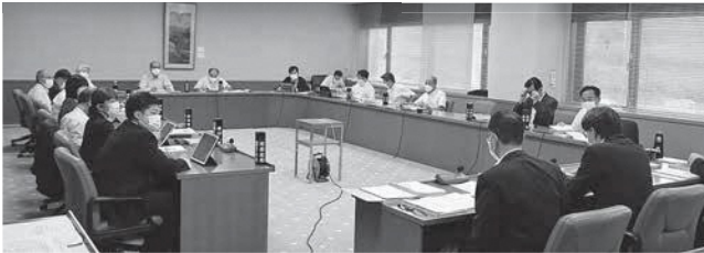
決算審査特別委員会の様子