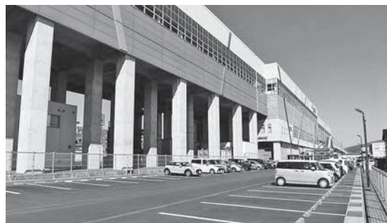
糸魚川駅アルプス口駐車場