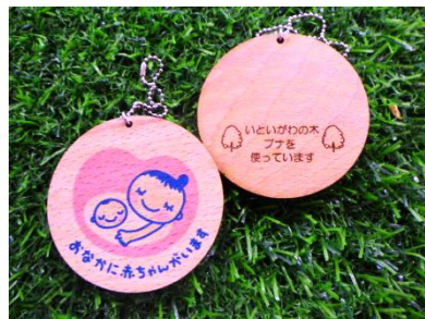
(木製マタニティマーク)