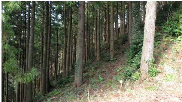
（大野地区 整備前の森林）