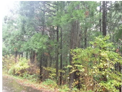
（桂・寺山地区 整備前の森林）