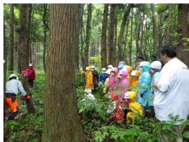
(森林体験教室の様子)