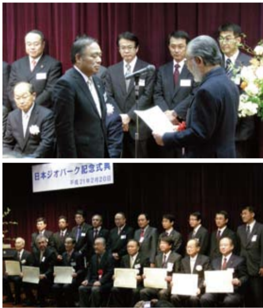
日本ジオパーク認定式典

世界ジオパークネットワークへの加盟協議が中国で開催され、このたび、糸魚川ジオパークの加盟が決定しました。 日本ジオパーク第1号でもあり、世界ジオパークへの加盟をめざして取り組んできましたが、日本初の世界ジオパークとなります。