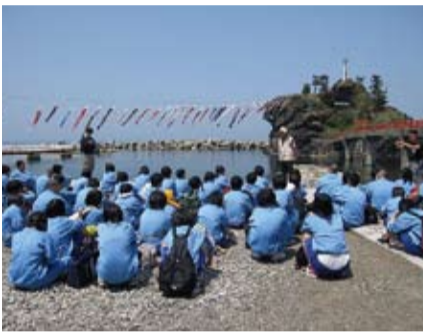
弁天岩ジオサイトでの学習(地元市民によるガイド)

ジオパークとは、「大地の公園」です。糸魚川市は、世界最古のヒスイ文化発祥地であり、フォッサマグナに代表される日本列島の形成にかかわる貴重な地質遺産や素晴らしい景観を見ることが出来ます。