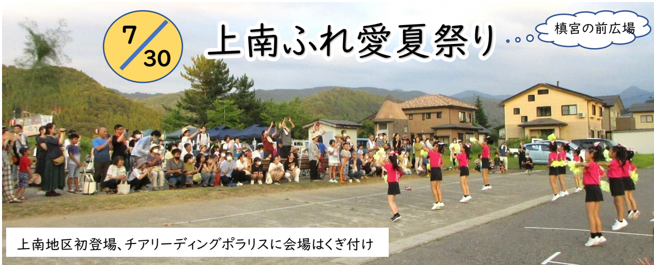
上南地区初登場、チアリーディングポラリスに会場はくぎ付け