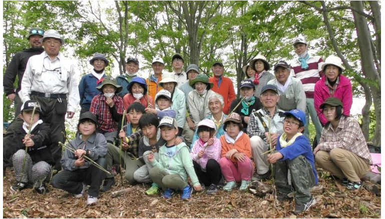
昨年は31名が参加。山頂での筍汁はお腹も心も満たしてくれました。

日時: 5月7日(土) 午前8時30分～ 午後2時(予定) ところ: 上南地区東谷内地内 集合場所: 上南地区公民館(8時30分) 対象: 糸魚川市在住の方ならどなたでも 小学3年生以下は保護者同伴でお願いします 参加費: 200円(中学生以下は無料) 持ち物: 昼食、おわん、箸、飲み物、クマ除けの鈴、防寒具、雨具、行動食、タオルなど 申込み: 4月25日(月)までに上南地区公民館(568-2533)へ その他: 健康ポイントラリー対象事業です。当日カードをお持ちください。(1ポイント)