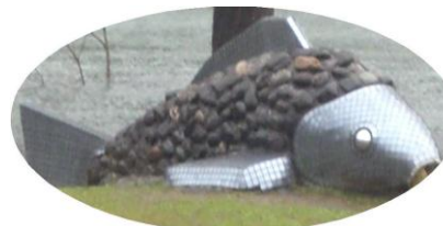
浪太郎が待っています

高浪の池カーニバルの復活？ そんな期待を持って、高浪の池 夏祭りを開催します。 今年は、第1回目の開催です ので、何かと至らないところ があるかと思いますが、皆 さんの参加で楽しい、にぎ やかな祭りにしたいと思います。 子どもたちが楽しめるもの も多くありますので、お近 くのお孫さんもお誘いいた だき、是非おいでください。 詳細の案内は後日致します。