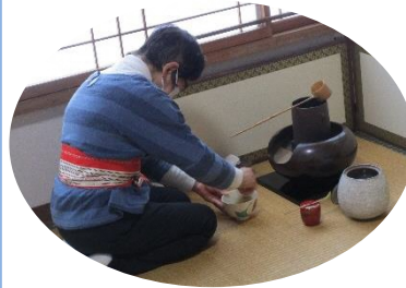
はじめにおてまえの一連の 流れを見せていただきました