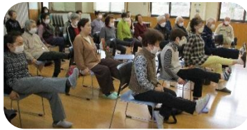
イスに座ったままでできる運動