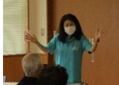
大野のみなさんすばらしいと ほめていただきました