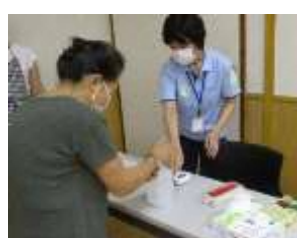
手の消毒と検温・受付