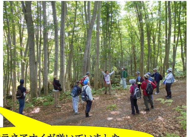
シラネアオイが咲いていました

紫陽花の鮮やかさが雨粒に映える季節、時折見せる晴れ間に、梅雨明けが待ち遠しく感じられます。