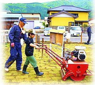
機械操作もおてのもの!

7月中旬まで芝の養生のため、フランコソーンは使用できません。ご理解のほどよろしくお願いいたします。