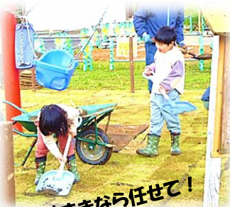
砂まきなららせて!

4/30(日)にっこにっこ広場芝はりプロジェクト第4弾! フランコソーンの芝はりが行われました。14名の地域の方や子供たちからご協力いただき芝はり完成! 不安定な天候の中、本当にありがとうございました!