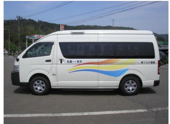
乗客定員13名の車両で運行しています。