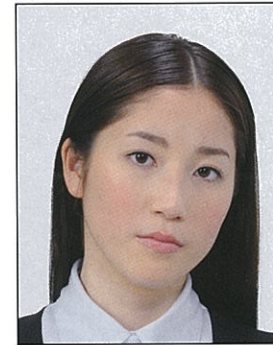
顔が左右に傾いているもの