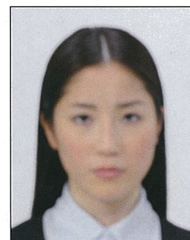
✕ ピンボケや手ブレにより不鮮明なもの

撮影時にピントが合っていないか、手ブレしてしまったために画像が不鮮明なものや背景に人物の影があるものは不適当です。