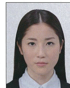
✕ ドットやインクのにじみなどがあるもの

デジタル印刷の場合、ドット（網状の点）やジャギー（階段状のギザギザ模様）、インクのにじみなどがみられるものは不適当です。写真専用紙等を使用し、鮮明な画質で印刷してください。