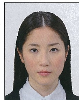
✕ ノイズがあるもの

画像ファイルの過剰な圧縮等が原因となってノイズ（画像の乱れ）が発生しているもの、変形やマスキング（縁取り）などの画像処理を施したものは不適当です。