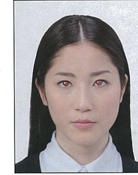
瞳がフラッシュ等により赤く写ったもの