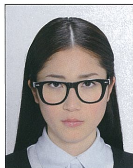
✕ フレームが非常に太く目や顔を覆う面積の大きいもの