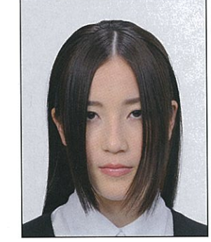
前髪が長すぎて目元が見えないもの 顔の輪郭が隠れるもの