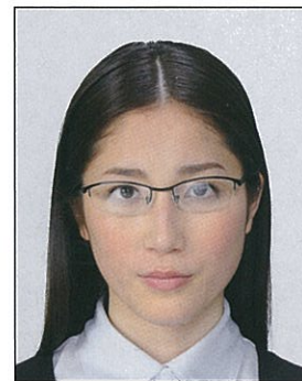
✕ 照明が眼鏡に反射したもの

撮影時にピントが合っていないか、手ブレしてしまったために画像が不鮮明なものや背景に人物の影があるものは不適当です。