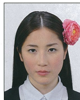
✕ 顔や頭の輪郭が隠れる装飾品等があるもの

画像ファイルの過剰な圧縮等が原因となってノイズ（画像の乱れ）が発生しているもの、変形やマスキング（縁取り）などの画像処理を施したものは不適当です。