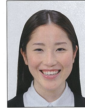
平常の顔貌と著しく異なるもの