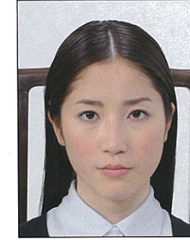
椅子等背景があるもの