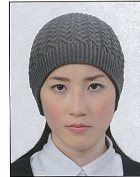
帽子によって頭部が隠れているもの