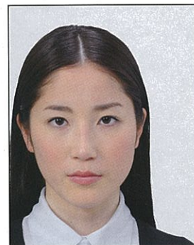
顔の位置が片寄っているもの