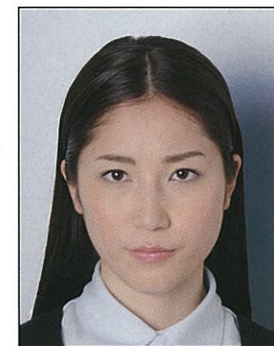
✕ 背景に影があるもの

デジタル印刷の場合、ドット（網状の点）やジャギー（階段状のギザギザ模様）、インクのにじみなどがみられるものは不適当です。写真専用紙等を使用し、鮮明な画質で印刷してください。