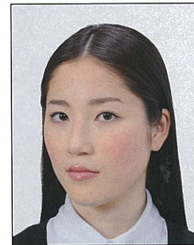
顔が横向きのもの