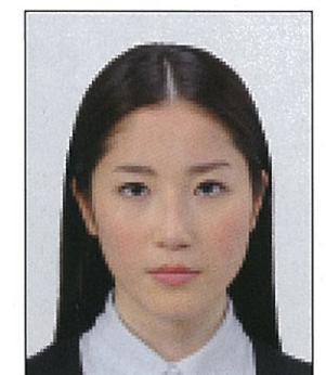
✕ ジャギーがあるもの

眼鏡やヘアバンド以外にも、帽子や衣服、布、マスク、イヤリング、カチューシャなど顔の器官が隠れるような大きめの装飾品等は好ましくありません。なお、顔の器官を隠さず髪を上げるため等の小ぶりな装飾品は受理しますが、着ける箇所によっては不適当となる場合があります。大きさ等の判断に迷う場合は装飾品をはずした写真をお持ちください。