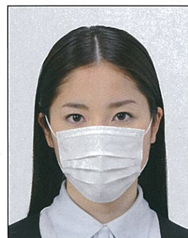
✕ 顔の器官が隠れる装飾品等があるもの