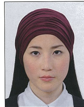
幅の広いヘアバンド等により頭部が隠れているもの