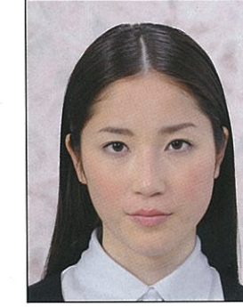
背景に柄があるもの