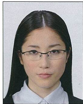
✕ 眼鏡のフレームが目にかかっているもの

今後、出入国審査等で旅券に内蔵されている IC チップに記録された顔画像とその旅券を提示した人物の顔を電子機器等で照合することが見込まれ、眼鏡のフレームや照明の反射が目にかかっているものやフレームが非常に太いものなどは、照合の妨げとなる可能性がありますので注意が必要です。