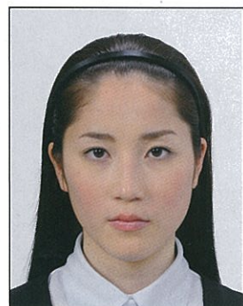
◎ 顔の器官を隠さず、小ぶりなもの

眼鏡やヘアバンド以外にも、帽子や衣服、布、マスク、イヤリング、カチューシャなど顔の器官が隠れるような大きめの装飾品等は好ましくありません。なお、顔の器官を隠さず髪を上げるため等の小ぶりな装飾品は受理しますが、着ける箇所によっては不適当となる場合があります。大きさ等の判断に迷う場合は装飾品をはずした写真をお持ちください。