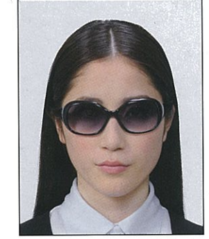
サングラスをかけ人物を特定できないもの