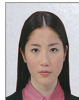
✕ 変形やマスキングなどの画像処理を施したもの

頭髪のボリュームが極端に大きな場合には、下図に示すように「两眼の中心から頭頂までの距離」は「两眼の中心から顎までの距離」と等しいものとみなして、トリミングしてください。