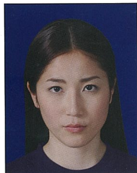
背景の色がきつく人物を特定しづらいもの