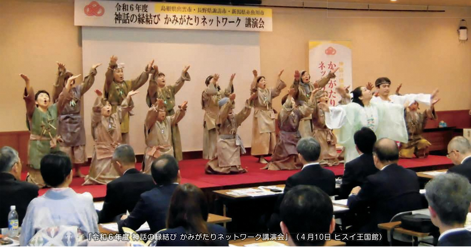
〔令和6年度「神話の縁結び かみがたりネットワーク講演会」(4月10日 ヒスイ王国館)〕