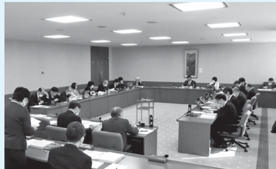
審査の様子(市役所第二委員会室)

※ YouTube「糸魚川市議会チャンネル」で 予算審査特別委員会の録画映像を配信しています。