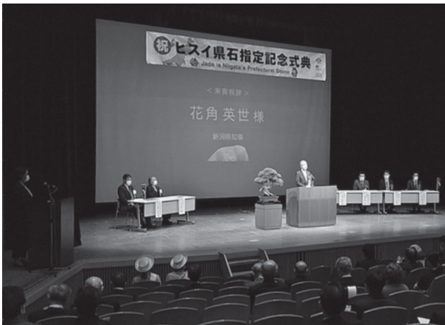
ヒスイ県石指定記念式典(令和4年11月4日 青海総合文化会館)

いずれの質問も、ヒスイなど岩石及び鉱物の価値や、各ジオパークの魅力の向上に資するアイデアであるが、ジオパークの発展やネットワーク貢献についても十分考慮した上で検討しなければならないものと考えている。