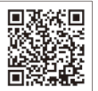
医療費控除明細書様式