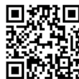
▲ 津波ハザードマップ