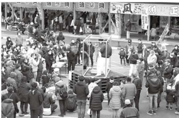
2023年1月のあんこう祭り（マリンドリーム能生）

当市自慢の冬の味覚あんこうを、市内外の皆様から、ぜひご賞味いただきたいと考えています。