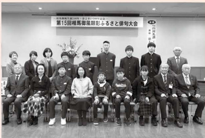
上位入賞者記念写真

一般の部、児童・生徒の部あわせて2,812句の応募作品の中から、146句が入賞しました。各部門の御風賞(最優秀賞)を掲載します。