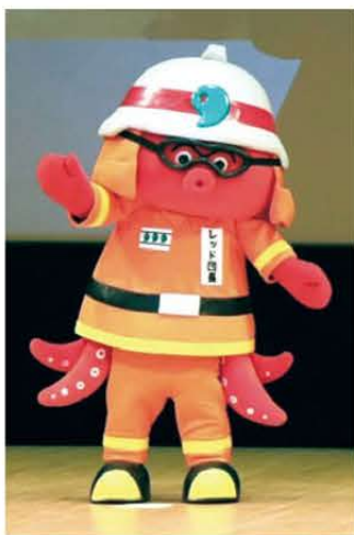
シンポジウムには レッド団長も登場

当日は、およそ300の方が来場し、火災を早期で発見することができる「住宅用火災警報器」を設置することの大切さや、地域での防災対策の取組などについて学ぶ機会となりました。