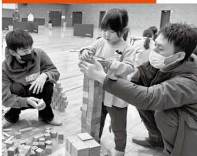
青海生涯学習センター