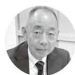
にいがた出会いサポートセンター 田海センター長

成婚200組突破を記念して、半年間のトライアルコースキャンペーン（登録料金3,000円／6か月間）を、1月31日（水）まで実施しています。「どのような方法でお相手を探すの？」「ちょっとチャレンジしてみたい！」など、そんな声にお応えして設定しました。気になる方は、この機会にぜひご利用ください。