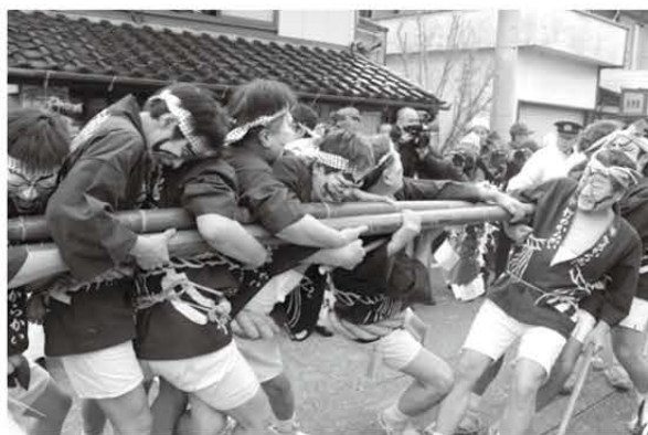
2019年に行われた青海の竹のからかい

新型コロナウイルス感染症の影響で中止としておりましたが、1月15日に、4年ぶりに開催します。地域文化功労者表彰を受賞された青海竹のからかい保存会の主催による、真冬の寒さに負けず、隈取りをした若い衆が2本の竹を引き合う姿や、この地域にしかない貴重な文化財を、ぜひご覧いただきたいと考えています。