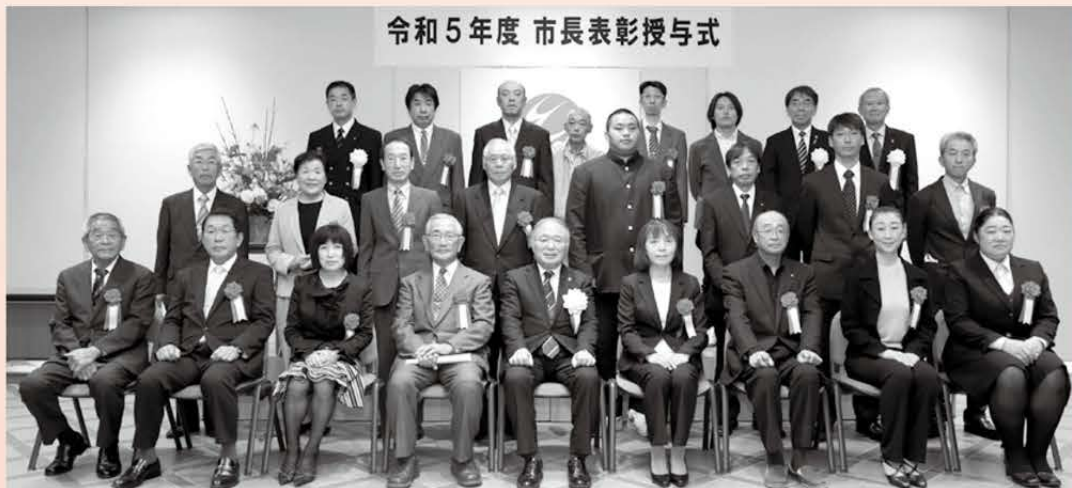
11月22日(水) 市役所で行われた表彰授与式にご出席いただいた皆さん