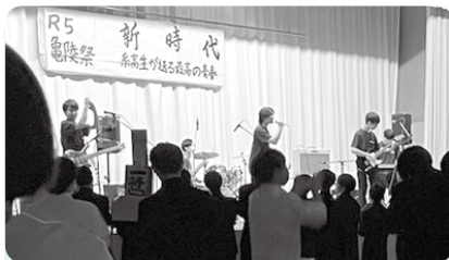
軽音部のステージ 盛り上がりました!