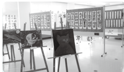
書道や絵など、素敵な作品を鑑賞しました