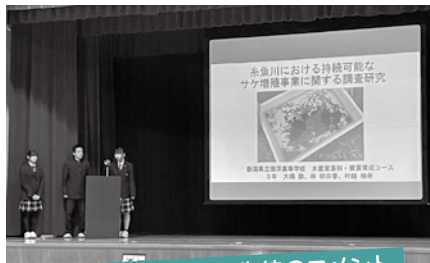
奨励賞を受賞した生徒のコメント

これからの糸魚川市の発展のために、この研究を事業の改善につなげてほしい。後輩たちには、この研究をさらに前に進めていってほしいと思います。