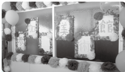
入場者が、作品を自分で作って飾る美術館!