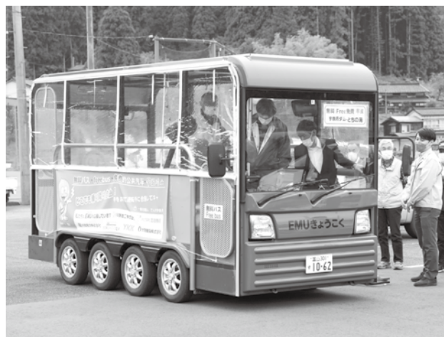
新たな交通手段として注目されるグリーンスローモビリティ試乗運行の様子