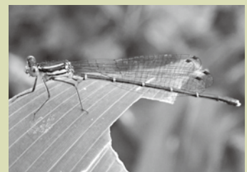
アマゴイルリトンボ