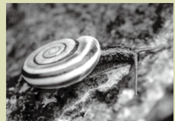
ムラヤママイマイ