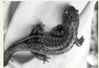
ヒダサンショウウオ