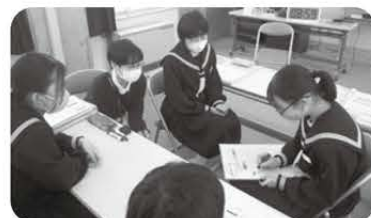
グループごとの意見が深まりました

現在、高校で支援を行っている私たちが中学校での取組を知る貴重な機会をいただきました。中学と高校の橋渡しの観点からも、魅力化活動につなげていきたいと思えます。