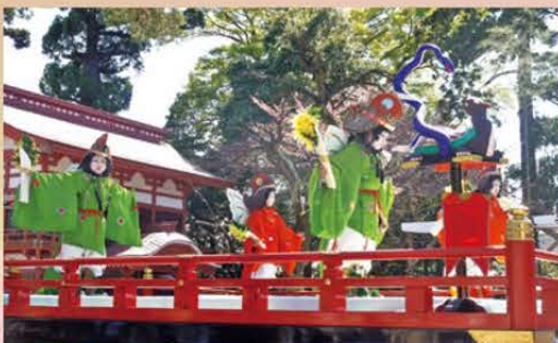
4人の稚児が舞う「鶏冠 けいかん 」