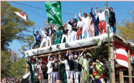
神輿のお走りの後は、境内に若衆の「ワッショイ、ワッショイ!」のにぎやかなかけ声が響きました