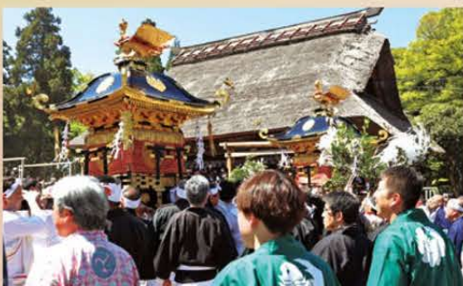
押上区・寺町区の若衆が担ぐ2基の神輿

新型コロナウイルス感染拡大防止のため、一部内容を変更し開催。押上区・寺町区の若衆が担ぐ2基の神輿が、境内を巡行し、神輿の後は舞楽が奉納されました。