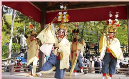
花天冠をかぶった稚児が優雅に舞います