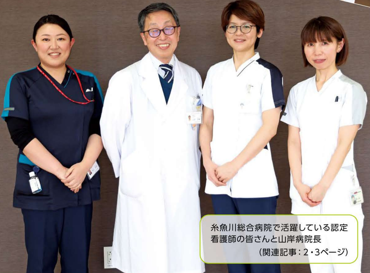
糸魚川総合病院で活躍している認定看護師の皆さんと山岸病院長 (関連記事：2・3ページ)