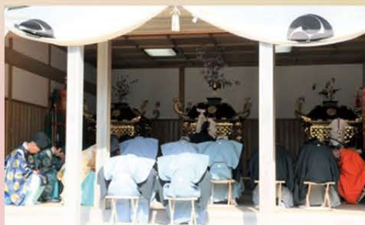
大祭式典のようす

今年は4年ぶりに3基の神輿が境内を勢いよく走り、その後、大祭式典が行われました。また、池の上に設営された舞台では舞楽が奉納され、大勢の観客を魅了しました。