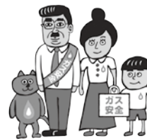
経済産業省 ガス安全広報キャラクター 我須野一家