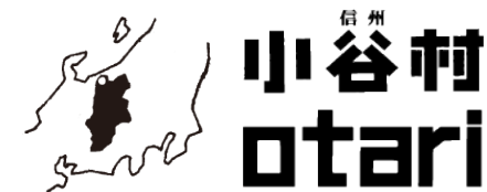
小谷村営バス 路線図