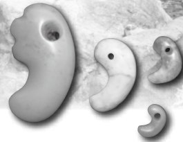
小滝川ヒスイ峡とヒスイ