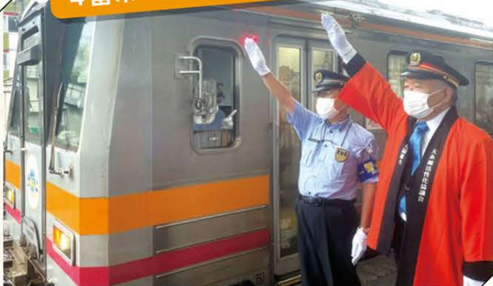
(写真左) 西日本旅客鉄道株式会社金沢支社 北陸広域鉄道部 柴田大糸線担当部長