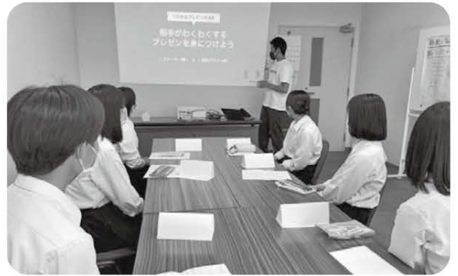
DAY 3 心を動かすプレゼンスキルを学ぶ