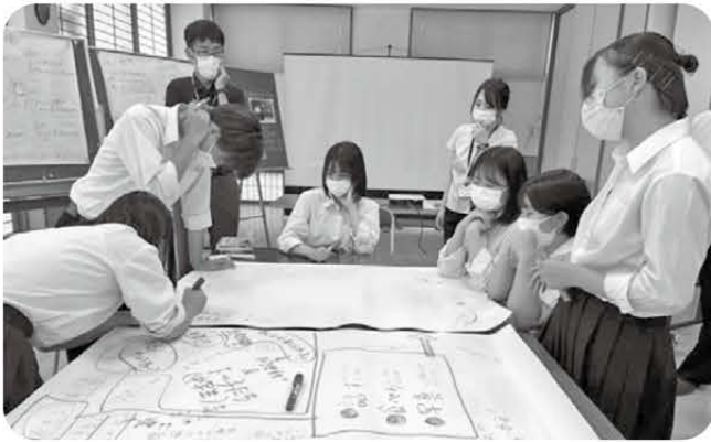
DAY 2 帰り道を検証、みんなで考えを共有する