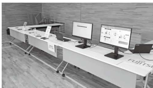
避難所受付システム

防災をテーマに、初めてのワーケーションツアーを開催しました。期間中、講演会に加え、市の防災訓練と連携したスマートフォンやデジタル技術を活用した避難所受付システムの実証実験を行いました。