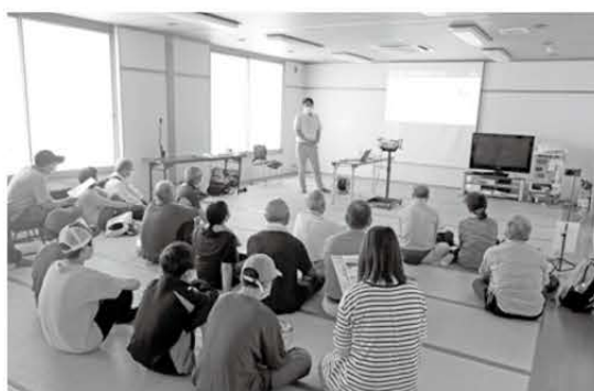
防災講演会のようす

防災をテーマに、初めてのワーケーションツアーを開催しました。期間中、講演会に加え、市の防災訓練と連携したスマートフォンやデジタル技術を活用した避難所受付システムの実証実験を行いました。