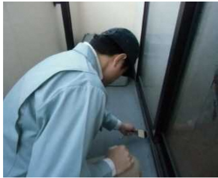
「外部（バルコニー）」調査の様子