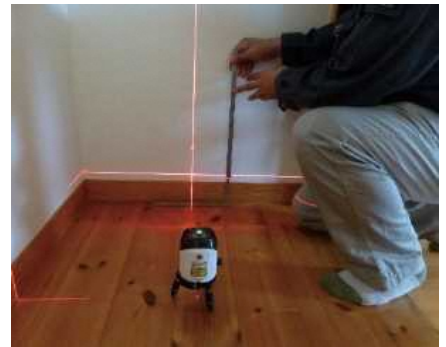
「床の傾きを計測する」調査機器