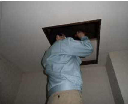
「小屋組・梁」調査の様子