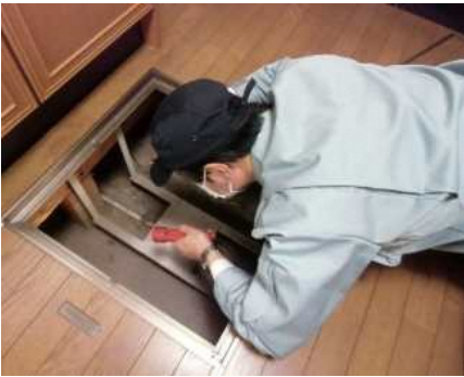
「土台・床組、基礎」調査の様子