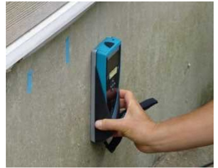
「基礎配筋」の調査機器