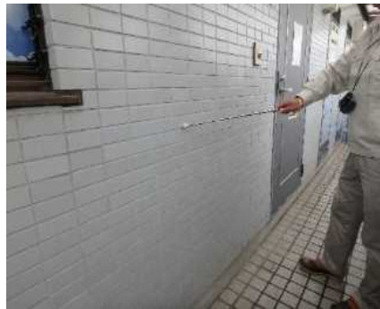
「外部（外壁）」調査の様子