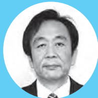
田原 実 議員

※QRコードをスマートフォンやタブレット端末で読み取ると、各議員の一般質問の録画中継を視聴できます。