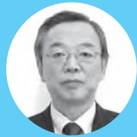
滝川 正義 議員