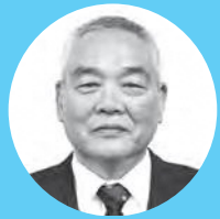
山本 剛 議員