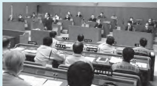
全員協議会の様子（1月18日）