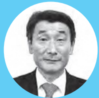
田中 立一 議員