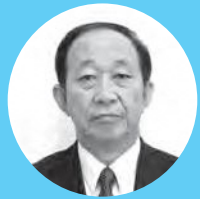
古川 昇 議員