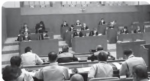
予算審査特別委員会の様子