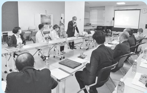
糸魚川総合病院との懇談

市民厚生常任委員会は、10月20日に糸魚川総合病院で委員会協議会を開催し、介護老人保健施設「なでしこ」が事業終了に至った経過や理由について説明を受けました。