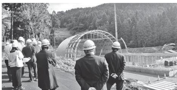
一般廃棄物最終処分場の建設現場を視察

答弁 降雨の強度を計算して設計・施工しているため、ある程度のもの是对応できるとしている。