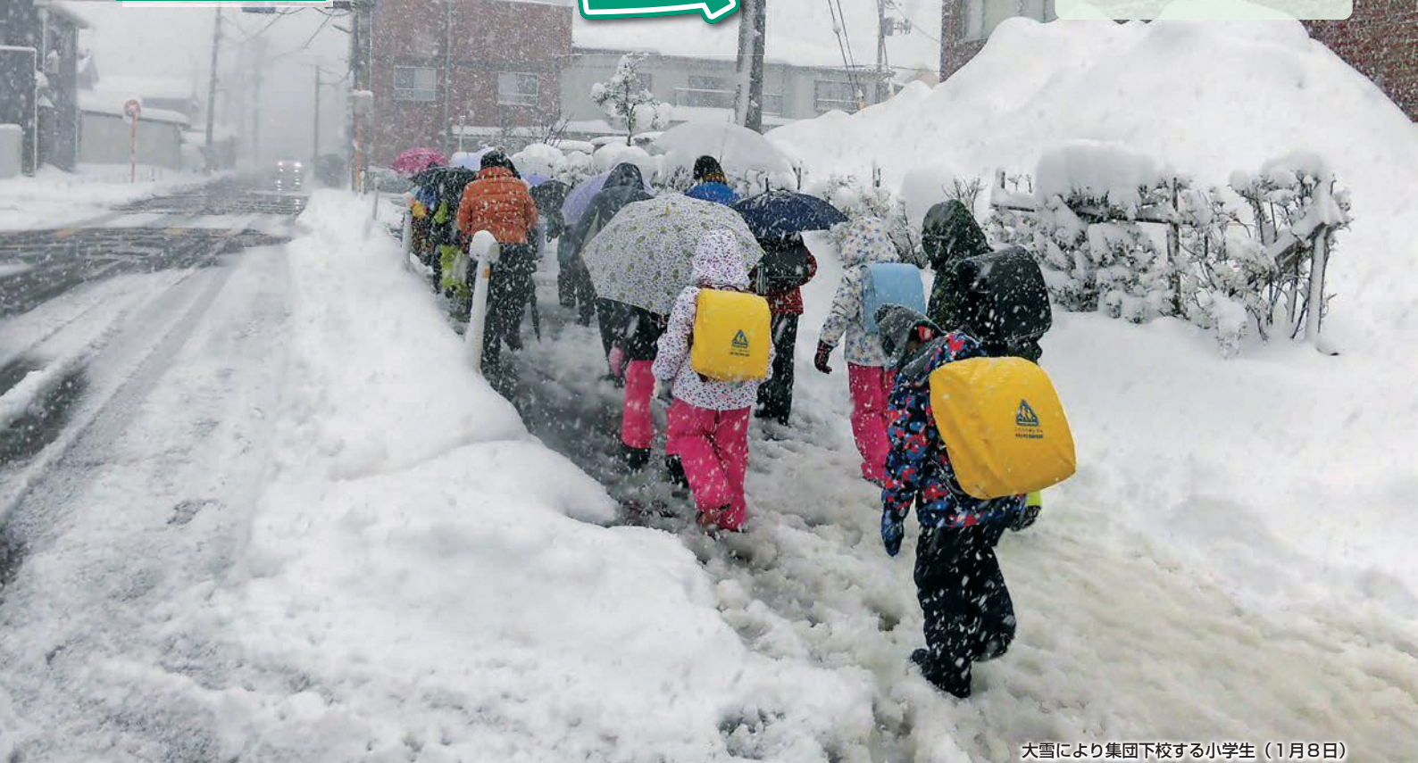
大雪により集団下校する小学生（1月8日）