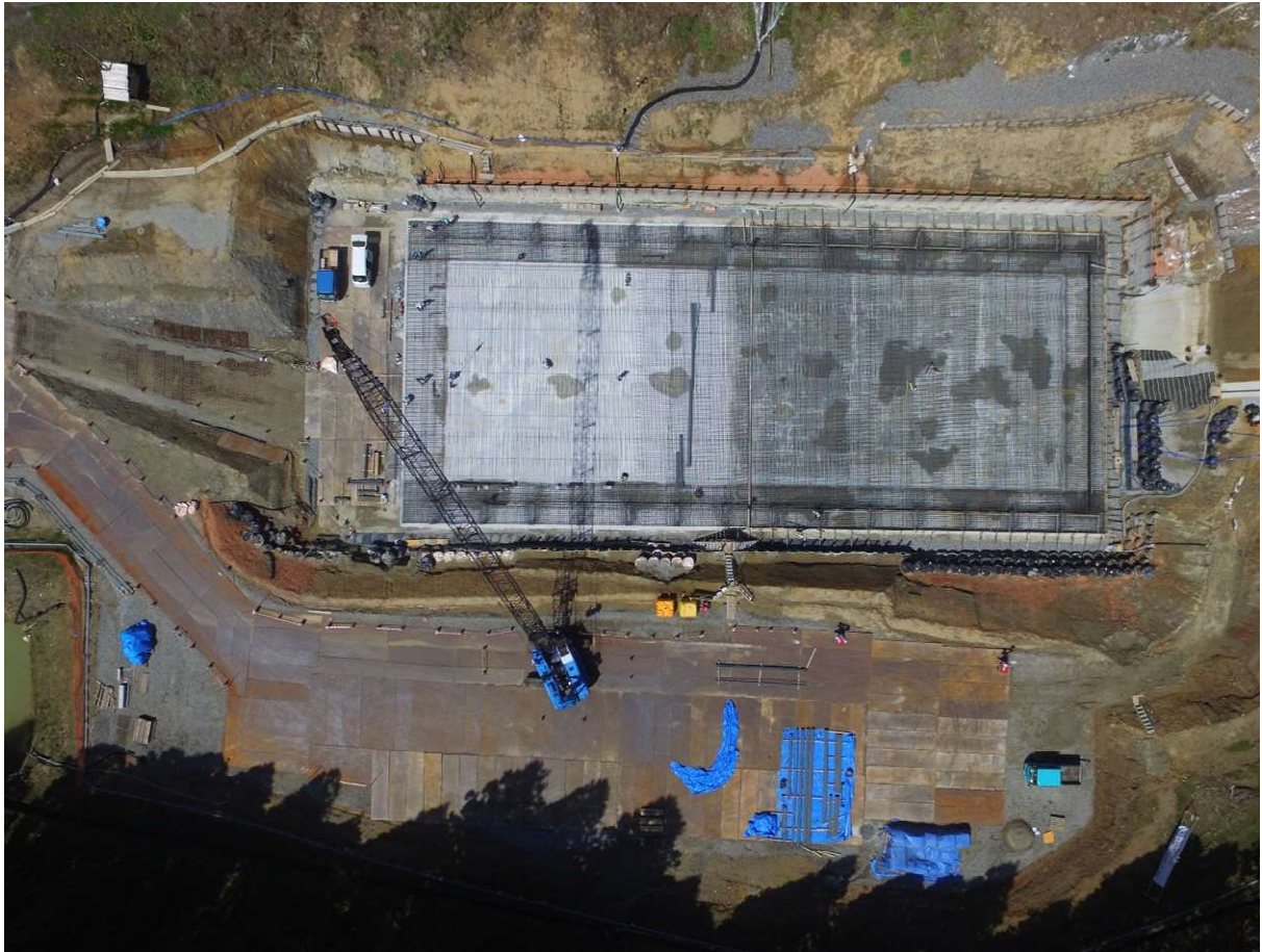
貯留構造物 底部配筋中