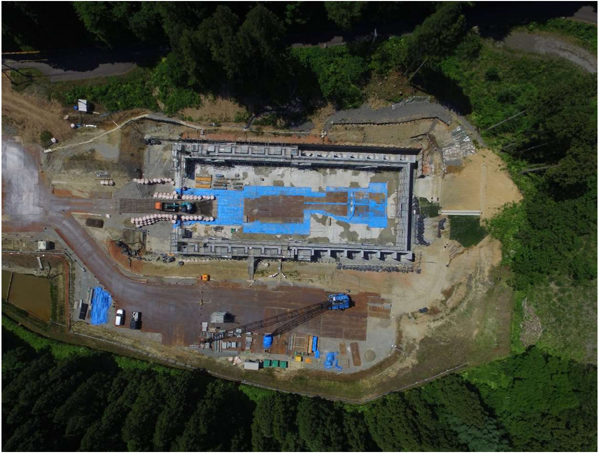
貯留構造物 側壁部配筋中